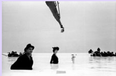
Nuovomondo di Emanuele Crialese

Proiezione di fotografie di Angelo Turetta, fotografo di scena